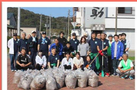
浦河町ふれあい公園 草取り。 2025年10月実施。