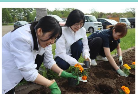
うらかわ優勝ビレッジAERU ウエルカムロード花壇整備。 2025年5月実施。